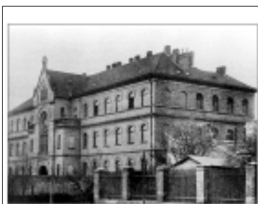
A kötetben szereplő tartalom: