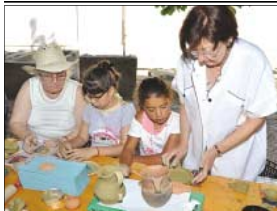
Az Aquincumi Múzeum romterülete adott otthont az Őkori Szünidő rendezvénynek július 20-án és 22-én. A 8-14 éves korú gyerekek bronzkori elődeink életével, római kori játékokkal ismerkedhettek, fibulát és agyagtárgyakat készíthettek, kincsvadászaton vehettek részt