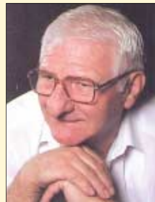
FIZETETT POLITIKAI HIRDETÉS

a Munkáspárt III. kerületi Szervezetének elnöke