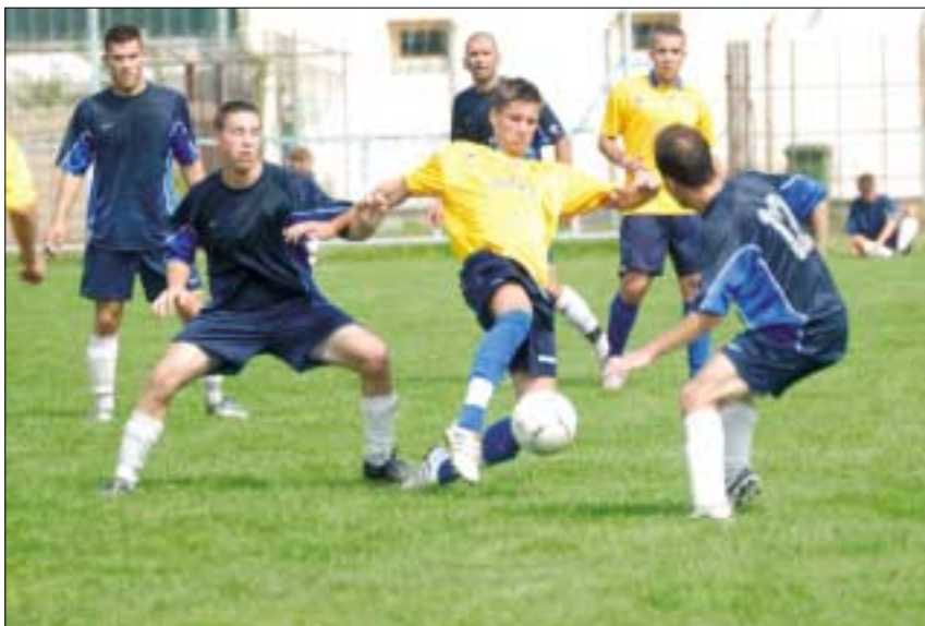
A TUE (sárgában) - Rojik edzőmérkőzésen még nem a tervezett csapat játszott