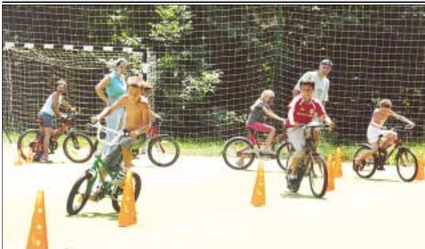
Nyári sport és kézműves napközis tábort szervezett több turnusban Csillaghegyen, a Keve-Kiserdei Általános Iskola melletti szabadidőpályán, erdei környezetben a CSMSZ Sportegyesület

Gyere velünk játszani! A vakáció alatt minden kedden 10 órától társasjátékozni hívunk a könyvtárba.