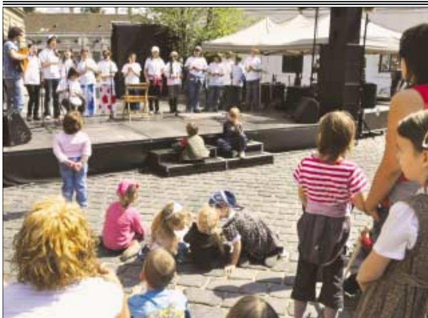
Tizenötödik alkalommal tartották a Szent György-napi sokadalom és kézműves vásár elnevezésű rendezvényt április 24-én a Fő téren. Az egész napos programban bemutakoztak a Waldorf iskolák művészeti csoportjai, népművészek és iparművészek kínálták portékáikat