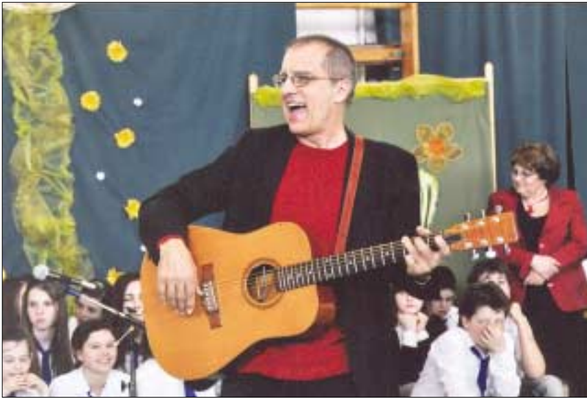
Háromnapos rendezvénysorozattal ünnepelte fennállásának 25. évfordulóját március végén az Aquincum Általános Iskola tantestülete és tanuló ifjúsága. Fellépett Huzella Péter, Kossuth-díjas előadóművész. Az eseményen részt vett Szepessy Tamás polgármester-helyettes