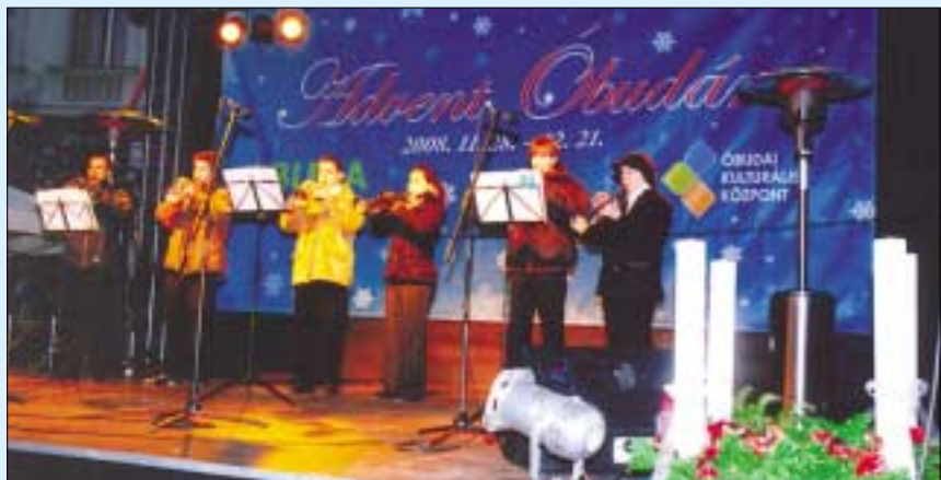
Az Aelia Sabina Alapfokú Művészetoktatási Iskola növendékei nyitották az óbudai intézmények előadásainak sorát november 28-án