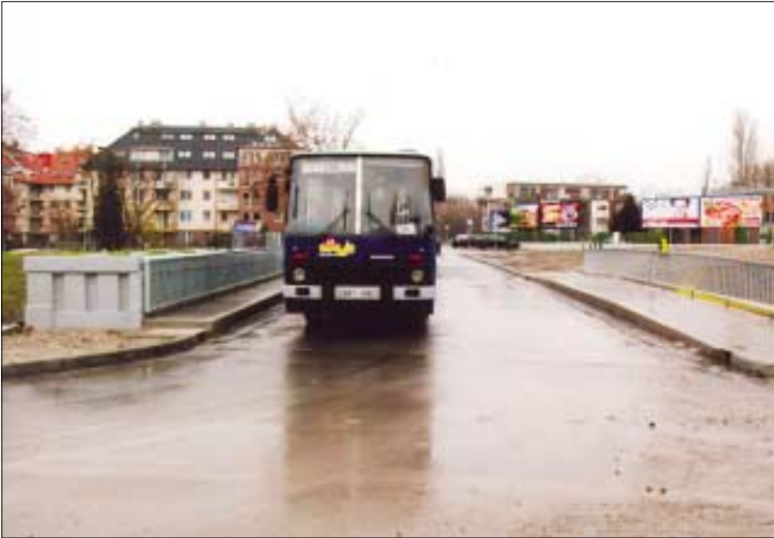
A Nánási úton, a Pók utcánál lévő hidat átadták a forgalomnak. A 106-os autóbuszok újra az eredeti útvonalon járnak