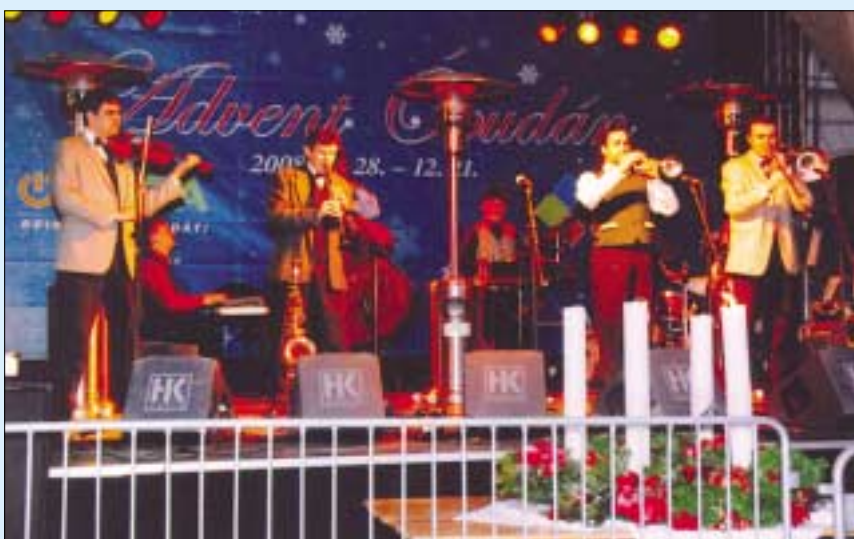
A Budapest Ragtime Band nagy sikerű koncertet adott