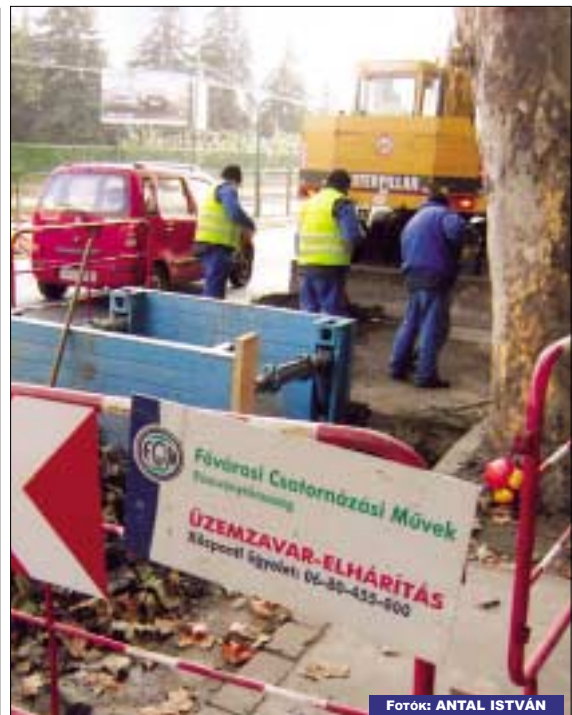
ÚTSZÜKÜLET. Az Árpád fejedelem útján, az Evező utcánál útszűkületre számítsanak a Margit híd felé tartók, mert csatornát javítanak