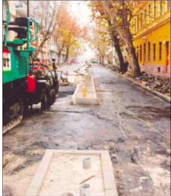
Óbudán, a Nagyszombat utcát lezárták a forgalom elől az Árpád fejedelem útja és a Lajos utca között, mert felújítják az útpályát