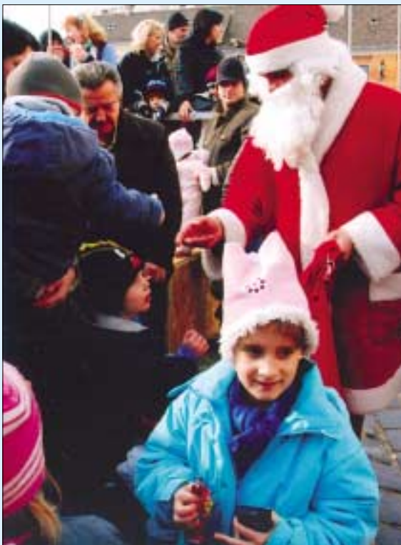
Óbuda szívébe is ellátogatott a Mikulás