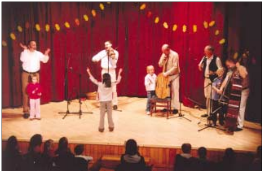
A Kolompos Együttes november 7-ei koncertjén a gyerekek felmehettek a színpadra, ahol a hangszerekkel ismerkedtek

A Four Fathers Énekegyüttes december 12-én kétszer is színpadra lép: 10 és 14 órakor. (Cím: Csobánka tér 5.)