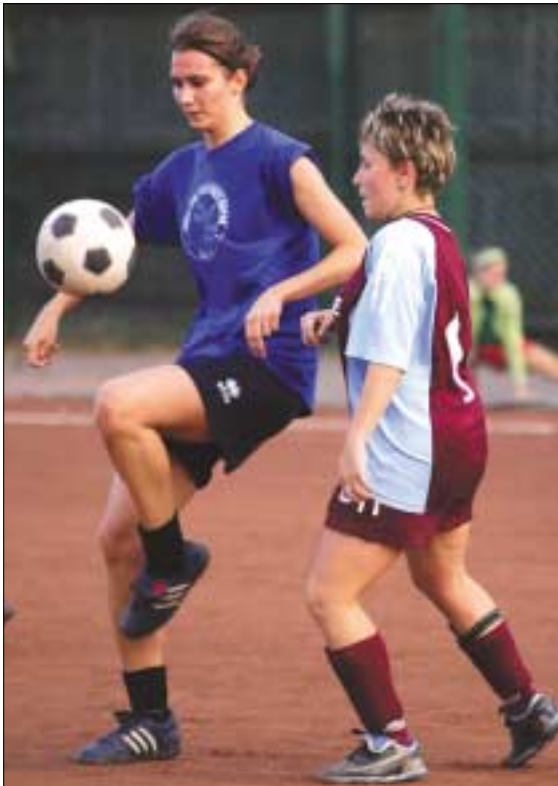
Az ELTE-Veres Péter Gimnázium (kék mezben) mérkőzést az egyetemisták győztek

A száz főt meghaladó mezőnyben széles skálán mozog a lányok, asszonyok jártékudása. Vannak lelkes kezdők, fontolva haladók és gyakorlott, egyesületekben szereplő profik. A bajnokság éppen ezért roppant érdekes. Öröm nézni az amazonokra jellemző harcias küzdelmet, a bájos ügyetlenkedést, de a mérkőzések többségén az érdekes és szórakoztató játék dominál.