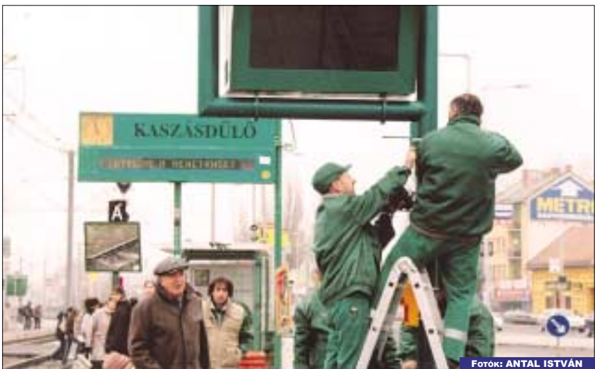
Digitális utastájékoztató táblákat szerelnek fel a BKV dolgozói a HÉV-megállók peronján a Batthyány tértől Békásmegyerig

A polgármesteri hivatal ügyfélfogadási rendje: hétfőn 14-től 18, szerdán 8-tól 16.30, csütörtökön 8-tól 12 óráig. Kedden és pénteken nincs félfogadás.