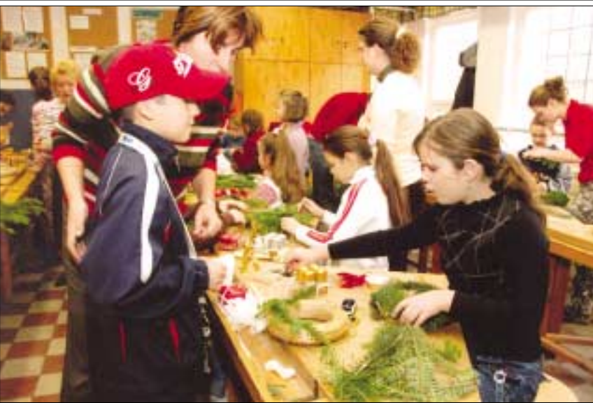
ADVENTI ELŐKÉSZÜLETEK A ZÁPORBAN. Adventi koszorút és ajándékokat készíthettek, mézeskalácsot süthettek és francia nyelvű játszóházban okosodhattak a gyerekek november 24-én a Zápor Általános Iskola és Gimnázium rendezvényén