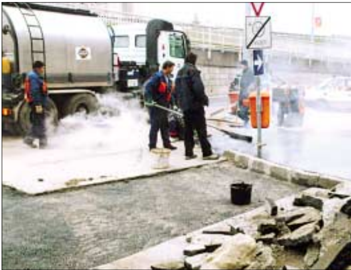
Útburkolati és járdahibákat javították ki a szakemberek múlt év decemberének közepén a Tavasz utcánál