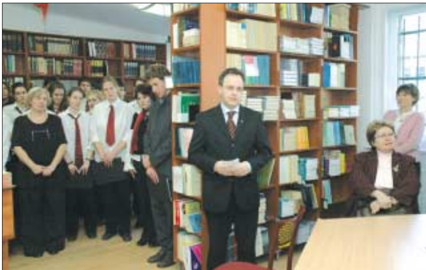
TUDÁSTÁRAT AVATTAK AZ ÁRPÁD GIMNÁZIUMBAN. Bús Balázs polgármester nyitotta meg az Árpád Gimnázium Tudástárát (könyvtár) tavaly december 21-én

AZ OKMÁNYIRODA NYITVA TARTÁSA. Az önkormányzat Harrer Pál utca 9-11. szám alatti Okmányirodája az alábbi telefonszámokon hívható. Az információk pultot a 437-8832-es telefonszámon érhetik el. A vállalkozói igazolvánnyal kapcsolatos kérdéseikre a 437-8809-es, a 437-8811-es és a 437-8812-es számokon válaszolnak. A személyi igazolvánnyal, a lakcímeikkel összefüggő ügyek intézéséről a 437-8813-as, a 437-8815-ös, a 437-8816-os, a 437-8817-es, a 437-8818-as, valamint a 437-8845-ös telefonszámokon kérhetnek előzetesen felvilágosítást. Vezetői engedéllyel kapcsolatban a következő számokon adnak információt: 437-8819, 437-8820. (Telefax: 437-8814.) A gépjárművek forgalomba helyezéséről és átírásáról a 437-8821 - 437-8831-ig közötti telefonszámokon tájékoztatják az ügyfeleket. Személygépkocsikra biztosítás köthető az Okmányirodában. Nyitva tartás: hétfőn 10-től 18, kedden, szerdán, csütörtökön 8-tól 14, pénteken 8-tól 12 óráig.