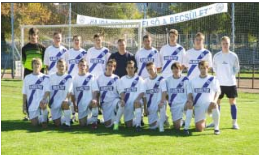
Az U 19-es legénység a kiemelt másodosztályú bajnokságban negyedik helyen zárta az őszi szezont

A fejlődés üteme számokban is mérhető. Induláskor még csak 130 gyerek és 6 csapat alkotta a szakosztályt, ma már 320 igazolt játékos és 15 csapat játszik kélférfi mezben. Sajnos, a létszám jelentős emelkedését egyáltalán nem követte a tárgyi feltételek javulása, ma is ugyanazon a három pályán gyakorol és játszik a rengeteg gyerek. Minduntalan visszatérő igény: az egyik játéktér műfüves pályává alakítása és tornacsarnok építése. Ehhez kevés a saját erő, csak kerületi össze-