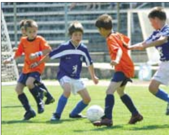
A legkisebbek is állják a versenyt a magasabb osztályú csapatokkal

U 15 és az U 13 korosztály szakosztályban folyó az NB I-es bajnokságban munkával és az eredm-